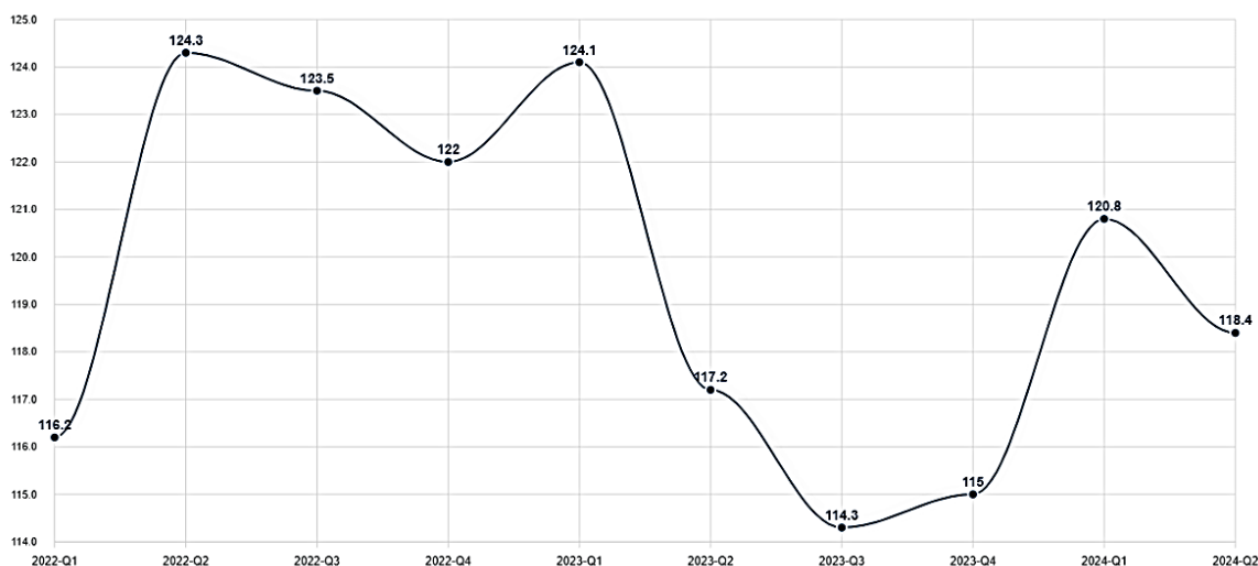
1-rasm. Aholi umumiy daromadlari o'sish sur'atlari (choraklik, foizda)

Pensiya tizimi. Pensiya tizimi O'zbekistonda nafaqaxo'rlar va nogironlar daromadlarini ta'minlovchi ijtimoiy himoyaning muhim qismidir. Hukumat pensiya to'lovlarini bosqichma-bosqich oshirdi, biroq mamlakat aholisining qarishi hisobga olingan holda pensiya tizimining uzoq muddatli barqarorligini ta'minlashda muammolar saqlanib qolmoqda.