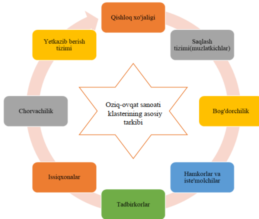
1-rasm. “Oziq-ovqat sanoati korxonasi klasterining asosiy tarkibi”ni tashkil etuvchi subyektlar 7 .

6. Yetkazib berish tizimlari oziq-ovqat sanoati klasterini tashkil etuvchi qishloq xo'jaligi, chorvachilik, bog'dorchilik va asosiy xomashyoni saqlash o'zaro tizimlarini birlashtiradi (1-rasm).