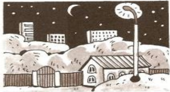
“Kunning qaysi vaqtligini aniqlash” nomli metodika uchun rasm.

XULOSA VA TAKLIFLAR: Xulosa qilib aytganda, o‘yin faoliyatining bola hayotida tutgan o‘rni beqiyos va u kichkintoyning ijodiy qobiliyatlarini rivojlantiruvchi bebaho vosita sifatida tan olinadi. O‘yin faoliyati bola hayotida, uning jismoniy, ruhiy, aqliy kamolotga yetishida muhim vositalardan biri hisoblanadi. O‘yin orqali bolalarda tafakkur, tasavvur, xotira, diqqat, idrok, sezgilar va nutq kabi barcha psixik jarayonlar rivojlanadi va atrof-muhit haqidagi bilimi yanada kengayib boradi. Ta‘limiy o‘yinlar yordamida bolalarda mustaqillik, faollik, ijodkorlik, masalaga ongli yondashish malakasi shakllantirib, o‘stirib boriladi. O‘yin ko‘rgazmalilik, oddiydan murakkabga o‘tish usullari orqali olib borilishi maqsadga muvofiq bo‘ladi. Maktabgacha ta‘lim muassasalarida ham mashg‘ulotlar o‘yin texnologiyalari amalga oshirib kelinmoqda. O‘yin texnologiyasi ham o‘yin metodidan o‘zining aniq maqsadi, amalga oshirish kerak bo‘lgan jarayonlarining mantiqiy ketma-ketligi va o‘zaro bog‘liqligi, oldindan belgilangan natijalarga erishish kafolati bilan farq qiladi. O‘yin texnologiyalarining ahamiyati borasida olib borilgan tadqiqotlarni ko‘rib chiqish maqsadga muvofiq. Shu bois maktabgacha bolalarni turli projektiv jarayonlarga faol qiziqishini uyg‘otish ularda o‘z ishiga bo‘lgan qiziqish va sabrni