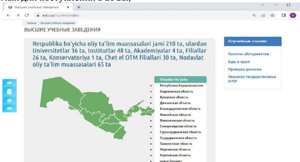
Рис.1. Список высших учебных заведений edu.uz

Вкладка абитуриентам содержит план приёма, приём в бакалавриат, приём в магистратуру, прием на второе образования, заочное обучение, список высших учебных заведений, а также информацию о стипендиях, заявлениях и документах, необходимых для поступления в ВУЗы,