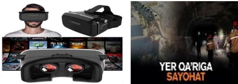
1-rasm. Qurilmaning umumiy ko'rinishi

Ushbu virtual sayohat auditoriyasini tashkil qilish asnosida quyidagi afzalliklarga ega bo'ladi: