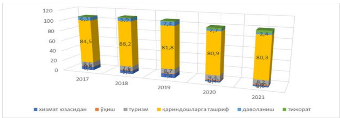
2-расм. Ўзбекистон Республикасига кировчи туристлар сонининг мақсади бўйича таркиби 82 .

Кировчи туристларнинг келишдан мақсади бўйича таркибидан кўринадики, асосий улуши қариндошларга ташрифга тўғри келмоқда. Яъни ушбу кўрсаткич жами кировчи туристларнинг 80-90 фоизини ташкил қилмоқда. Бироқ умумий тенденцияда пандемиягача бўлган даврда ушбу кўрсаткичнинг ҳам ижобий ўзгаришлари кузатишга бўлиб, айнан сайёҳлик мақсадида келувчи туристларнинг улуши деярли икки борабарга ошиши таъминланган. 2021 йилга келиб хизмат юзасидан ташриф буюрувчилар улушида кескин пасайиши кузатилиб 5,9 фоиздан 2,6 фоизгача камайди. Айнан шу йили қариндошларга ташриф буюрувчилар улуши 84,5 фоиздан 80,3 фоизга камайганини қўришимиз мумкин. Пандемия шароитида 2021 йилга келиб, қариндошларга ташриф буюрувчилар улуши пасайиши ҳисобига, тижорат мақсадида келувчи туристлар улуши 3,9 фоизга ўсиб, 4,7 фоизга етди.