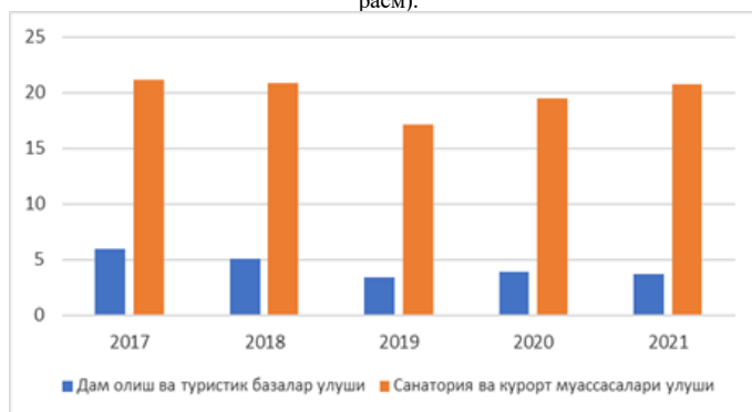
3-расм. Вилоятда дам олиш ва туристик базалар, санатория ва курорт муассасалари улушини ўзгариш динамикаси 84

Таъкидлаш жоизки, таҳлилларимизга кўра, вилоятнинг мавжуд туристик имкониятлари ҳамда ушбу йўналишда амалга оширилган таҳлил натижаларига асосланган ҳолда туризмнинг дам олиш ва ҳордик чиқариш йўналишлари воҳа учун айнан мақбул ва истиқболли ҳисобланади. Буни инобатга ҳолда вилоятда ушбу йўналишларда ривожланиш динамикасининг қиёсий таҳлилини қараб чиқамиз (3-расм).