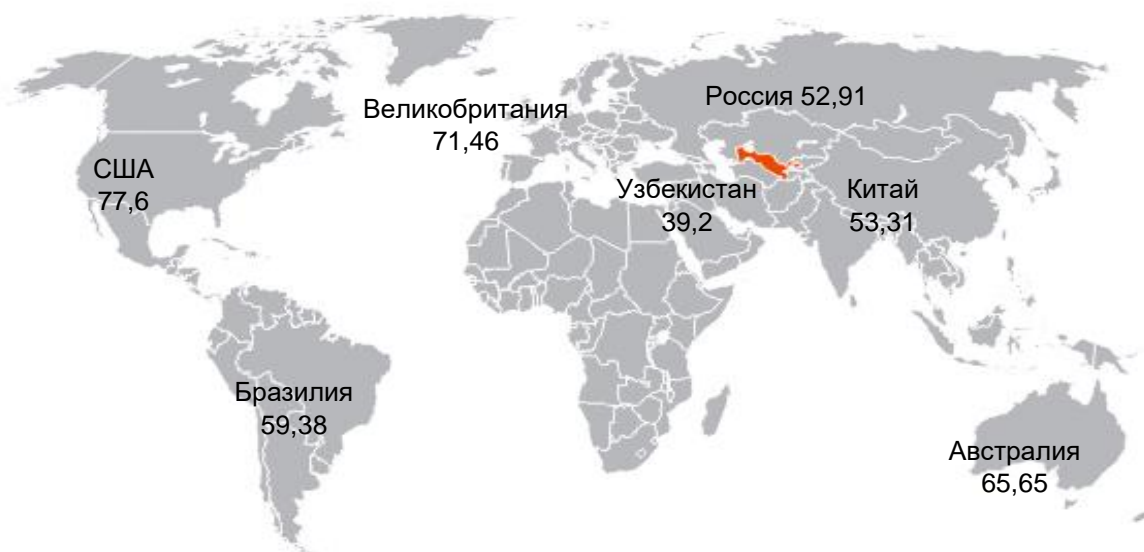
Рисунок 1. Доля сферы услуг в ВВП стран мира 2021 год (в %)

За 2021 год добавленная стоимость сферы услуг в ВВП (1-рисунок) Швейцарии составила 71,92 % 1) , Великобритании - 71,46 % 1) , Франции – 70,34 % 1) , Австралии - 65,65 % 1) , Германии - 62,88 % 1) , Бразилии – 59,38 % 1) , Китае – 53,31 % 1) , России – 52,91 % 1) .