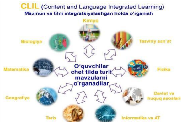
2-rasm. Fanlar va o'zaro bog'liqlik

CLIL texnologiyasi asosida ingliz tilini hamda o'rganilishi rejalashtirilayotgan kontentni har jihatdan mukammal o'rganish mumkin. Bu kabi texnologiyalar o'rganuvchining qiziqishlarini hamda bilishga va o'rganishga bo'lgan ishtiyoqini oshiradi. CLIL metodi orqali quyidagi fanlar o'zaro birikishi mumkin (2-rasm)