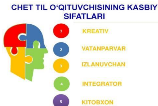
3-rasm. CLILdan foydalanish uchun kerak bo'ladigan sifatlar.

Biroq ushbu metodni muvaffaqiyatli qo'llash uchun nafaqat o'quvchilar, balki o'qituvchilar ham ushbu yondashuv bo'yicha maxsus tayyorgarlikka ega bo'lishi zarur. Tadqiqotlarga ko'ra, o'qituvchilarning bilim va malakasi talabalarning o'quv jarayoniga faol jalb etilishida hal qiluvchi omil ekanligi ta'kidlanadi (Harrop, 2012). O'qituvchilarning nafaqat ingliz tilini, balki keyingi fanni o'qitish usullarini mukammal egallashi, dars materiallarini moslashtirish qobiliyati katta ahamiyatga ega. Ushbu xulosalar CLIL metodining samaradorligi haqida ko'plab tadqiqotlar bilan hamohangdir (Mehisto, Marsh va Frigols, 2008). Chet tili o'qituvchisi CLIL metodidan foydalanyotganda qanday xususiyatlar ega bo'lishi va dars jarayonida amalga qo'llashi quyidagi grafikda ko'rsatilib o'tiladi (3-rasm):