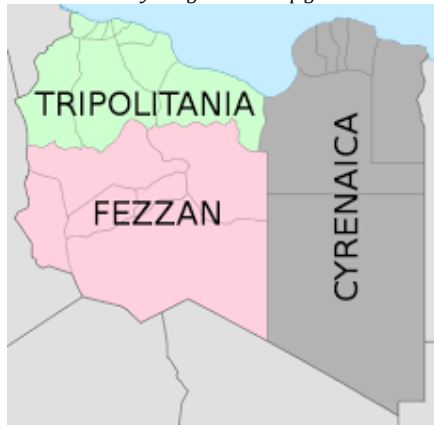
1-rasm. Liviyaning uch mintaqaga bo'linishi